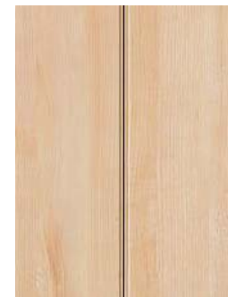
PH型(取っ手レスタイプ)