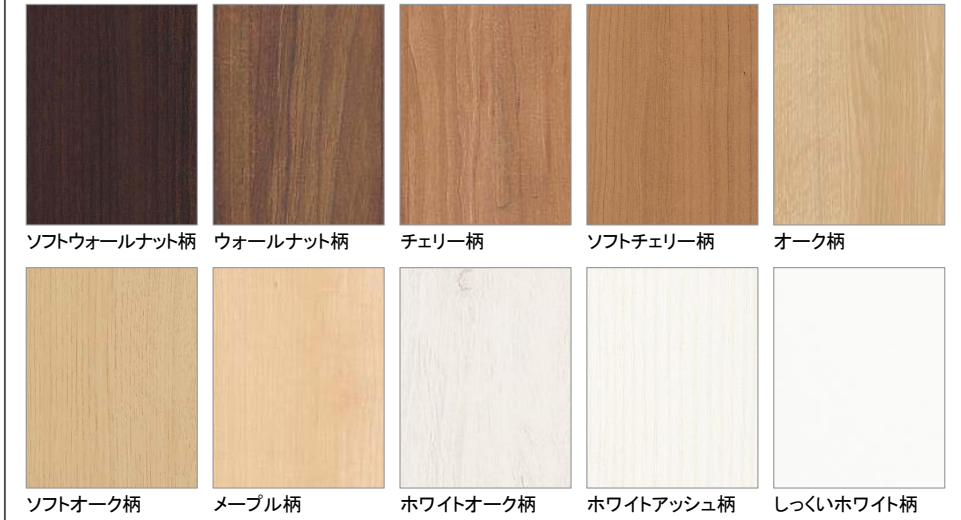
ソフトウォールナット柄 ウォールナット柄 チェリー柄 ソフトチェリー柄 オーク柄