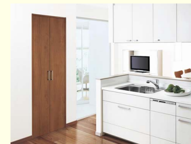
キッチン(パントリー) 2枚の扉を手前に開いて全開口になる開き扉。ピン・カン類、食器などの収納に最適です。

階段下等や踊り場の壁面を収納スペースとして有効活用できます。また、壁収納にも対応しています。