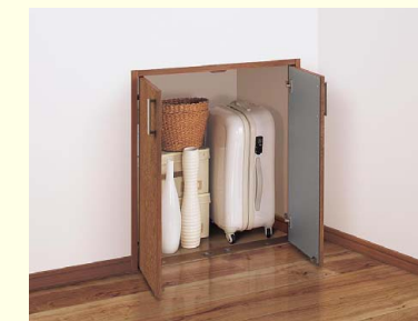
階段(階段下収納) 階段下のスペースを有効活用し、掃除機などかさばる物をすっきり収納できます。