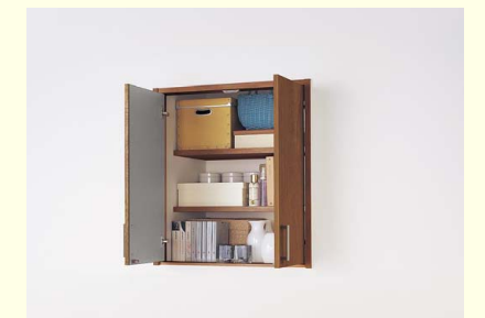
トイレ(壁収納) 収納スペースの確保が難しいトイレでも壁を利用して空間を有効活用できます。