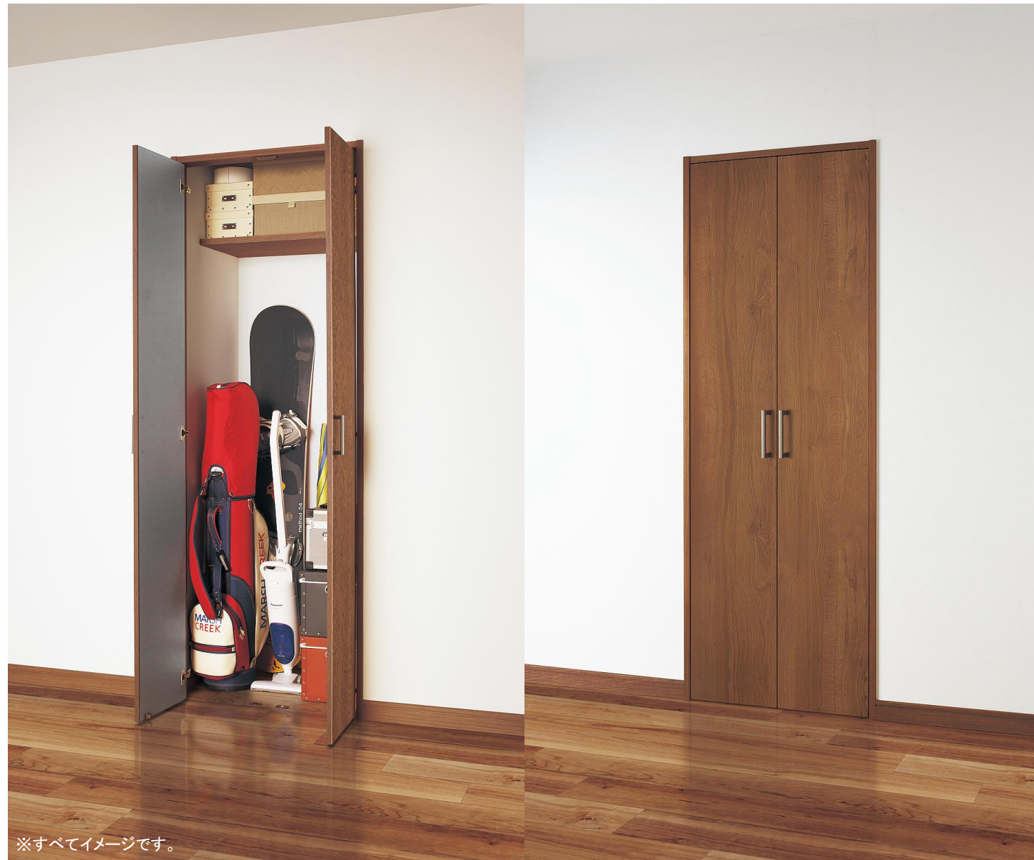
※すべてイメージです。