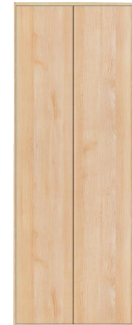
PH型(取っ手レスタイプ)